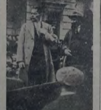
A SU LLEGADA A MOSCÚ

Recepción triunfal del escritor en Rusia. El gran escritor ruso Máximo Gorki cumplió sesenta años en el mes de marzo último.