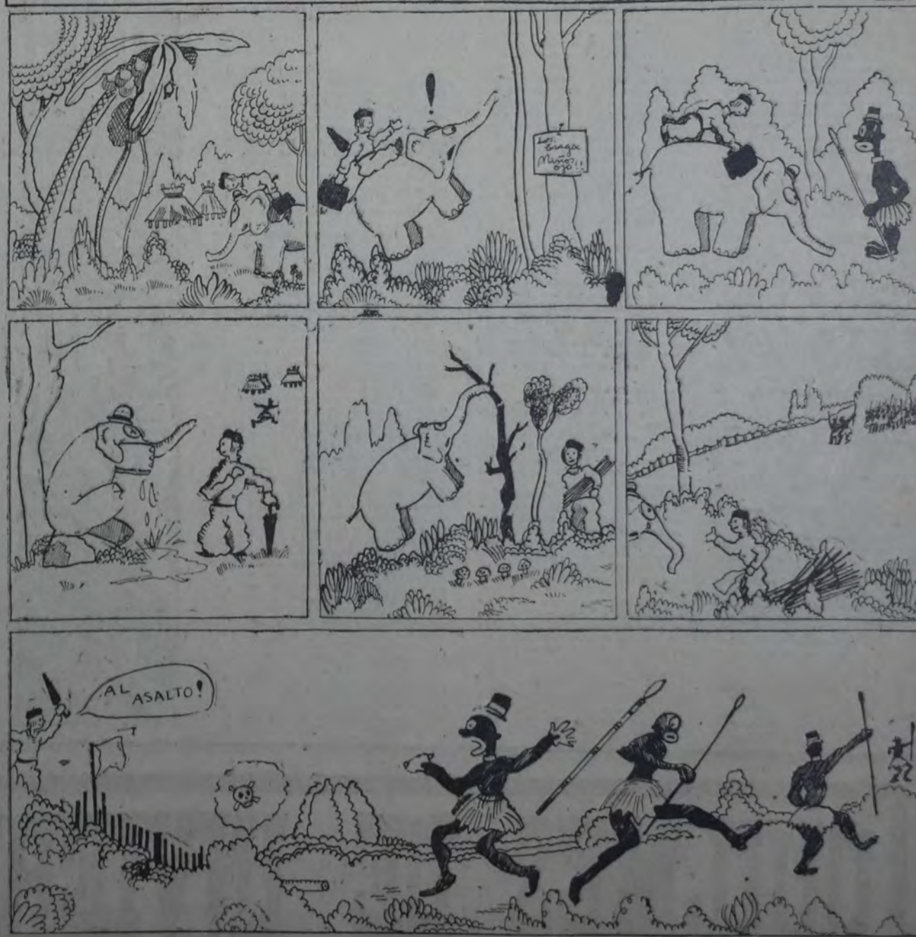
DE COMO CUCCHARITA SALVO LA VIDA EN EL PAIS DE LOS CANIBALES