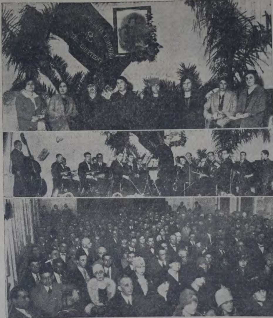
ARRIBA: LA COMISION ORGANIZADORA DEL HOMENAJE — EN EL CENTRO: LA ORQUESTA QUE PRESTO su desinteresado y valioso concurso — Abajo: Aspecto del salón

a dar forma concreta a la evocación íntima... La parte musical del acto, estuvo a cargo de la orquesta que dirige el maestro Aarón Klasse, y excusamos decir que su ejecución fue apreciada como lo merece por el público que escuchó con verdadero recogimiento los diferentes números.